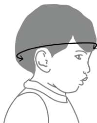
Obvod hlavy dítěte

Tip: Pokud nemáte krejčovský metr, změřte obvod hlavy jakoukoli šňůrkou a naměřenou délku šňůrky potom změřte pevným metrem.