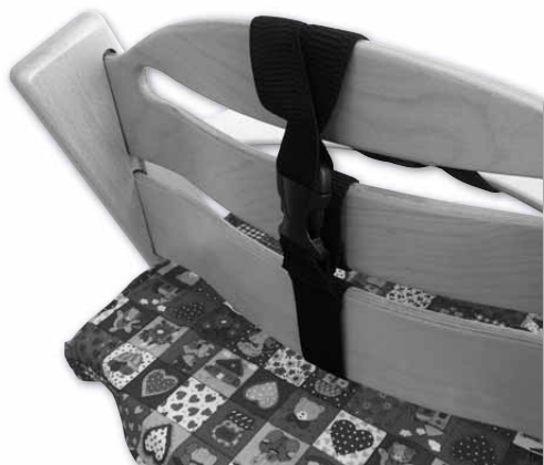
Zapnutí pultíkových kšandiček na zadní části opěrek