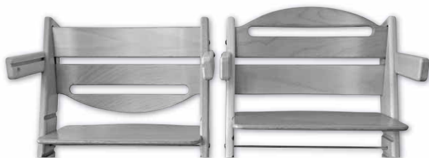
Správně umístěná zvýšená opěrka zad