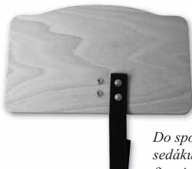
Do spodní strany malého sedáku připevníme druhy pro fixaci mezinožního pásku (MP)